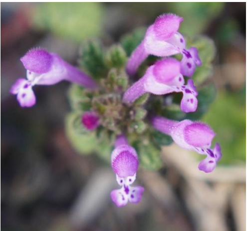
当院南面の地面にて

台座が仏が座る蓮の花の様であるが、田平子(たびらこ)をさし、食用になるのは小鬼田平子とされている。七草粥のタビラコはキク科で黄色い花をつけると言われています。