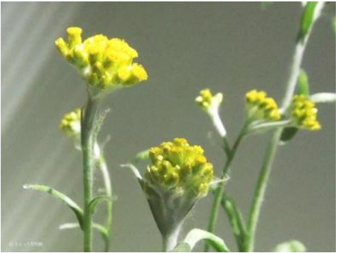
ゴギョウウ