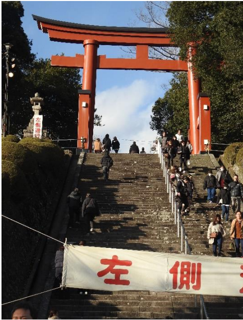
富岡市貫前神社鳥居