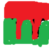
CLAY +New Color (Green)