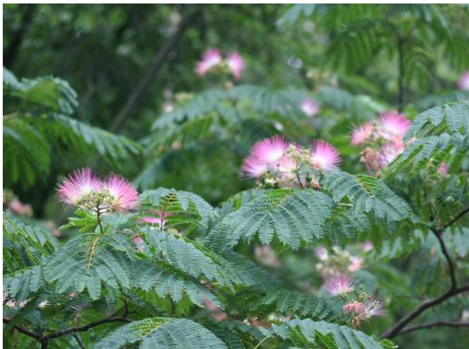
象潟や雨に西施がねぶの花