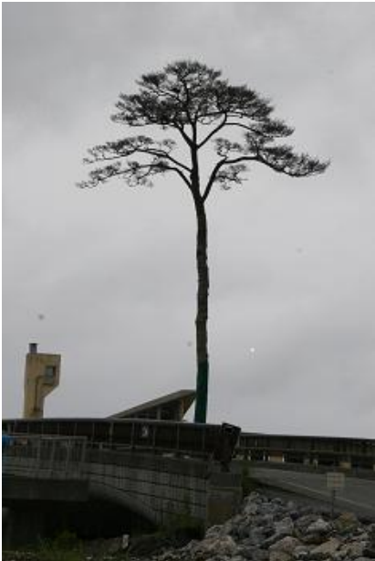
陸前高田 奇跡の松